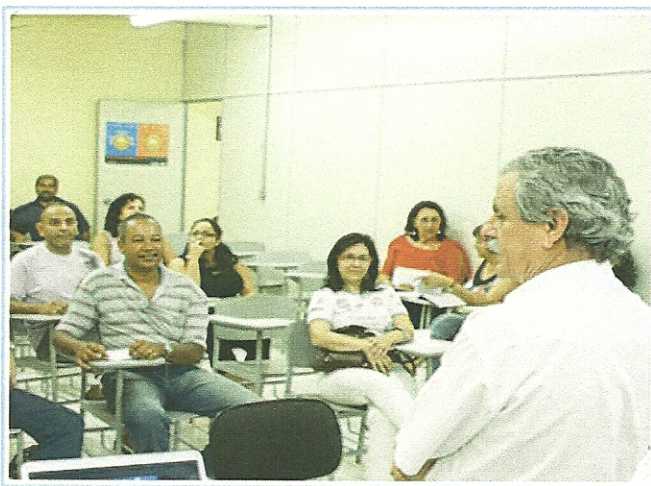
A reunião contou com a participação dos conselheiros e representantes de associações de moradores

A concessão da rodovia Regis Bittencourt-BR 116 tem gerado algumas polêmicas e dúvidas. Para esclarecer, o Conselho Municipal de Desenvolvimento Urbano convocou uma reunião, na última quarta-feira, dia 4, no auditório do Centro de Voluntariado, com representantes da empresa que administra a BR-116, a Autopista e membros do Conselho.